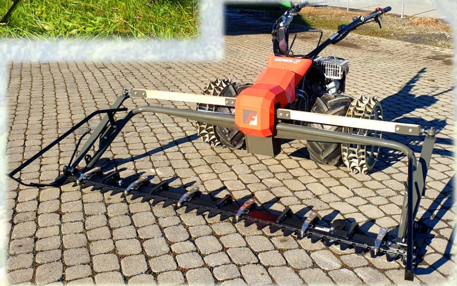
Reform RM8 mit Doppelmessermähwerk Arbeitsbreite 2.00m