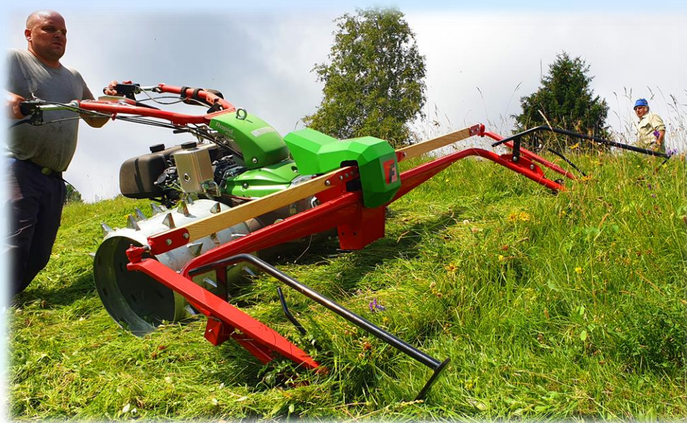
Rapid Monta mit Doppelmessermähwerk Arbeitsbreite 2.40m

www.faessler-landtechnik.ch info@faessler-landtechnik.ch