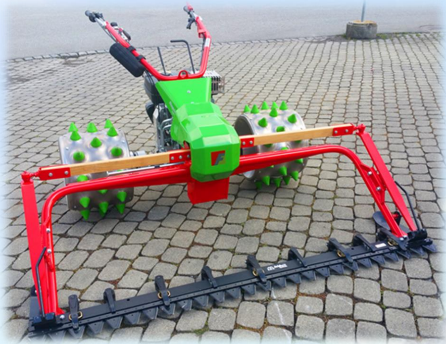
Rapid Swiss mit Doppelmessermähwerk Arbeitsbreite 2.00m