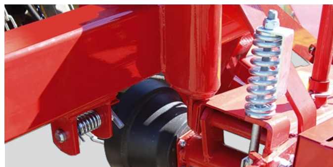
Belt tensioning spring. Ressort tendeur de courroie.