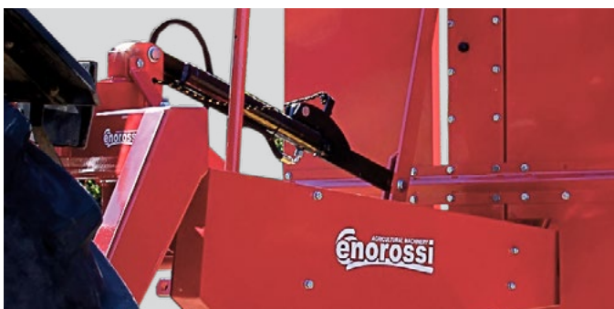
Hydraulic lift (Optional). Levage hydraulique (Sur demande).

Les ressorts de compensation permettent de transférer la charge de la faucheuse au tracteur, minimisant la pression sur le sol.