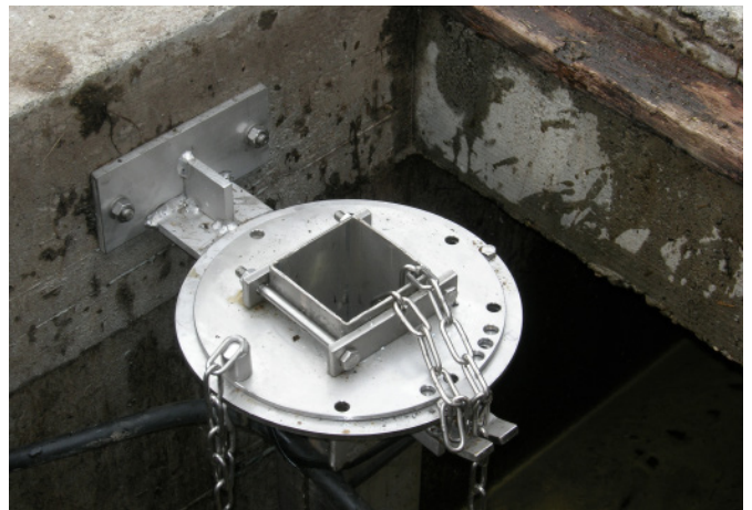
Absenk- und Schwenkvorrichtung – versenkte Ausführung