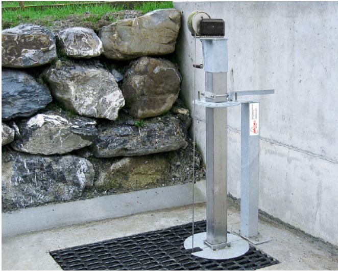
Absenk- und Schwenkvorrichtung