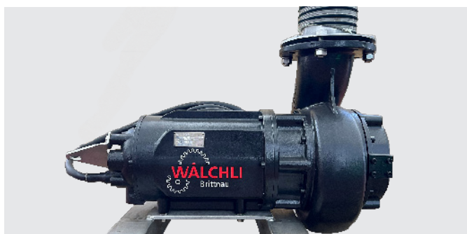
Pompe à lisier immergée couchée