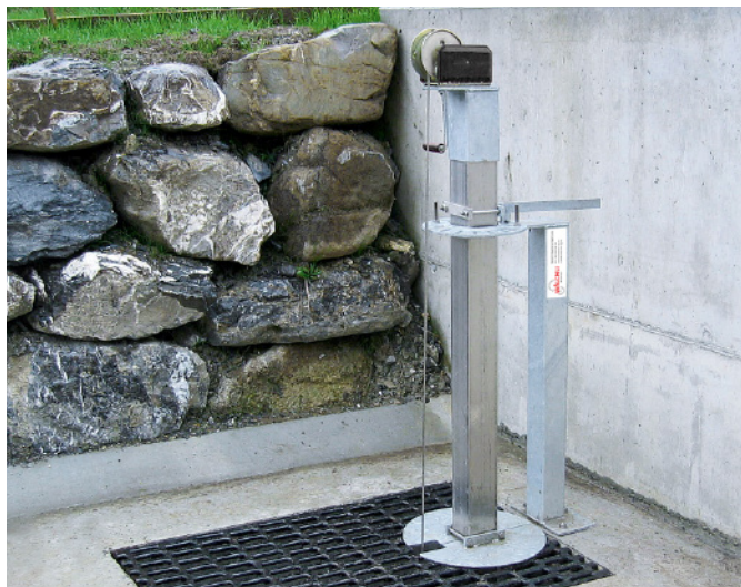
Dispositif de pivotement et d'abaissement