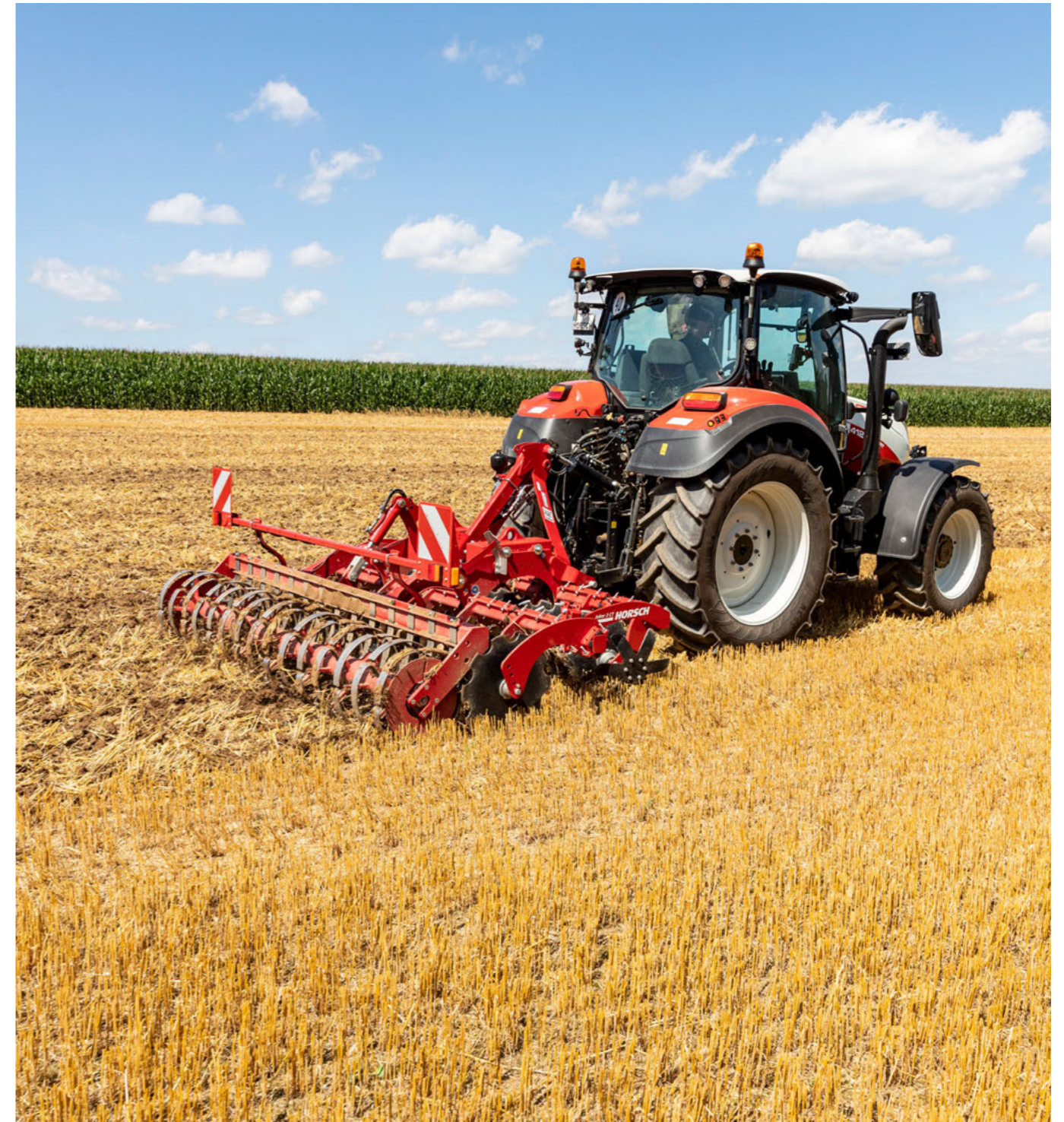
In den Arbeitsbreiten von 3 bis 7 m