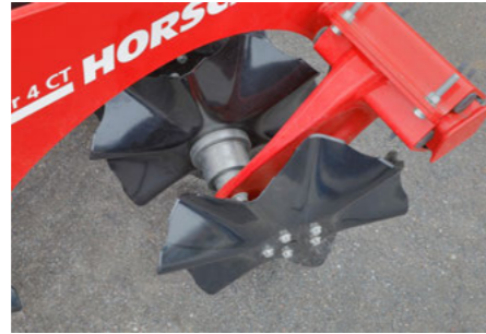
CoverCrush Disc Ø 52 cm