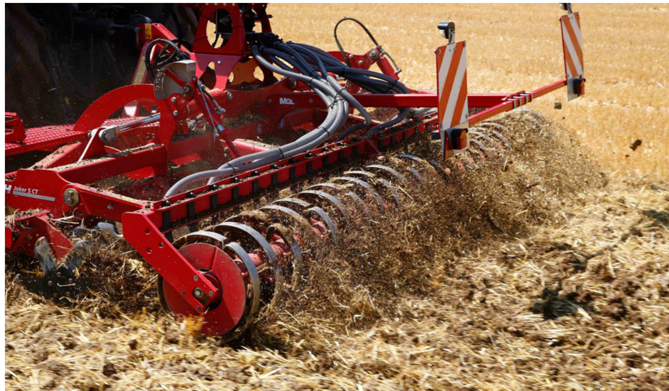
Optional mit MiniDrill für die Aussaat von Zwischenfrüchten