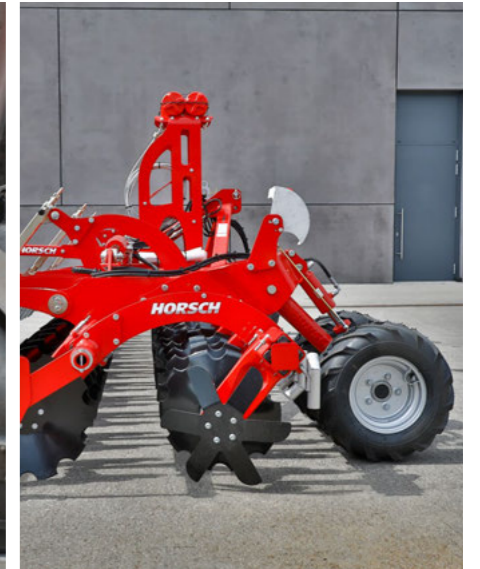
Gülleausführung ohne Packer, mit Striegel für geringste Verstopfungsanfälligkeit