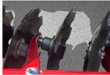
Scheibe gezahnt Ø 52 cm