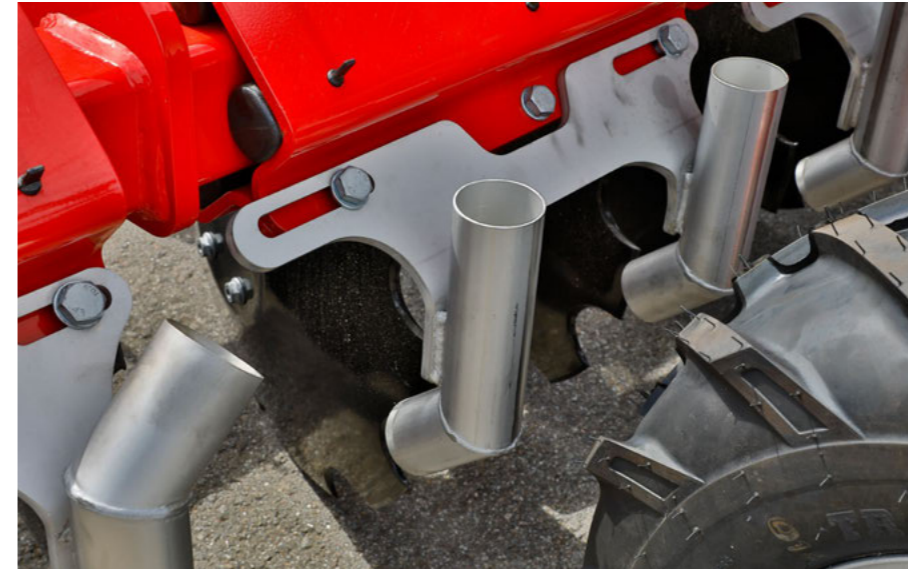
Gülleauslässe aus Edelstahl für höchste Langlebigkeit