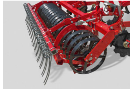
Striegel hinten 1-reihig Optional mit Nachlaufstriegel