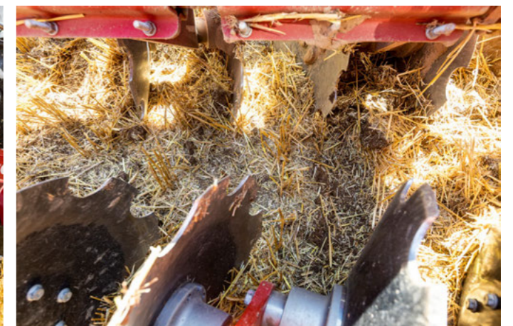
Paarweise Anordnung der Scheiben für maximalen Durchgang