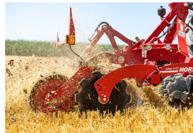
Optional mit Randscheibe

Durch den aggressiven Winkel der Scheiben mit gezacktem Profil besitzt die Joker ein sehr gutes Einzugsverhalten in den Untergrund. Sollte es dennoch Problemen im Einzugsverhalten geben, besteht die Möglichkeit, die Maschine mit Zusatzgewichten zu bestücken, um den Einzug zu verbessern. In Verbindung mit dem Tiefenlockerer HORSCH Mono TG besteht die Möglichkeit einer tiefen Lockerung in Verbindung mit einem flachen Etmischen von Ernterückständen. In Verbindung mit Güllekits eignet sich die HORSCH Joker auch optimal für das Einarbeiten von organischen Düngern oder in Verbindung mit einer MiniDrill zur Aussaat von Zwischenfrüchten. Zusammengefasst ist die HORSCH Joker eine Kurzscheibenegge, die sich optimal für die flache Bodenbearbeitung, den Stoppelsturz, die Einarbeitung von organischer Masse oder die Saatbettbereitung eignet.