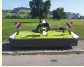
CLAAS Corto 3200 F Profil SHV, Neu, Jg. 2023, 3.05 m Arbeitsbreite