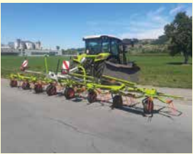
CLAAS Volto 900 Neu, Jg. 2024, 8.7 m Arbeitsbreite