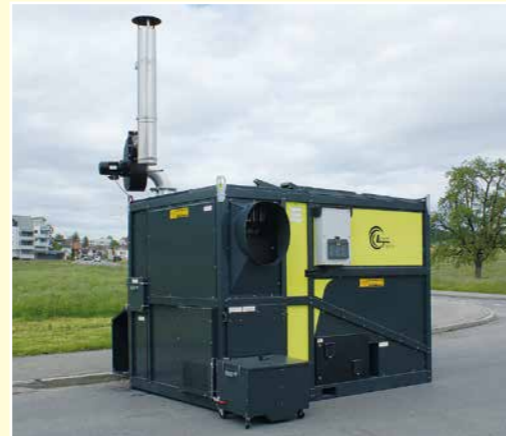
Stückholz günstig und einfach Wärmeleistung 28 kW bis 425 kW

Hackschnitzel effizient, leistungsstark und vollautomatisch Wärmeleistung 150 kW bis 2500 kW