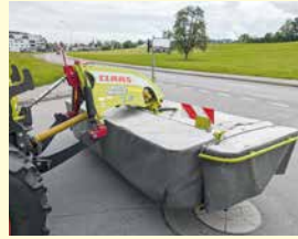
CLAAS Disco 3100 F Profil Jg. 2010, revidiert, 3.00 m Arbeitsbreite