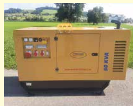
Bertoli Notstromaggregat Neu, Jg. 2023, 50 kVA, AVR, 3-Zylinder FPT, schallisoliert