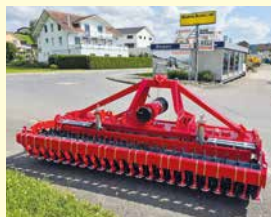
Breviglieri Kreiselegge MekFarmer 150, Neu, Jg. 2024, 3 m Arbeitsbreite