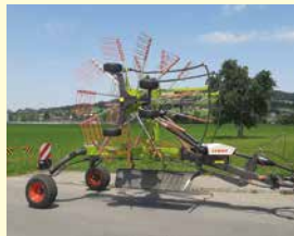
CLAAS Liner 2600 Trend Demo, Jg. 2022, 6.2 m Arbeitsbreite