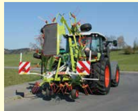
CLAAS Volto 60 Neu, Jg. 2024, Tastrad, Grenzstreueinrichtung