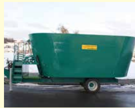
Zitech Killer V2-23 23 m 3 , Jg. 2014, Gummi- band vorne, Waage