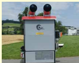
LASCO Stückgut-Warmluft- ofen LA 325, Neu, Jg. 2024, 325 kW Heizleistung, Rauchgasregelung