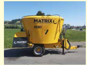
Matrix Xeno 7 Demo, Jg. 2022, 7 m 3 , Querförder- band hinten, Waage