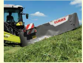
CLAAS Disco 28 Neu, Jg. 2022, 2.6 m Arbeitsbreite