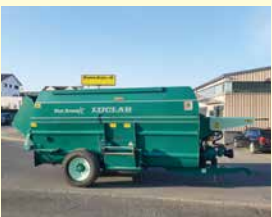
Luclar Taurus 17, Jg. 2009, 17 m 3 , Austrag li+re, hydr. Heckklappe, Waage