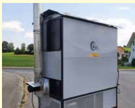
LASCO Stückgut-Warmluft- ofen LA 425, Neu, Jg. 2023, 425 kW Heizleistung, Doppelvergaser