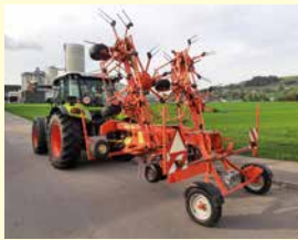
Kuhn 8501 T0 Jg. 2008, Fahrwerk, Grenzstreueinrichtung