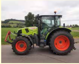
CLAAS Arion 410 CIS Swiss + 80 h, Jg. 2022, FH, FZ, Klima, Niederdach