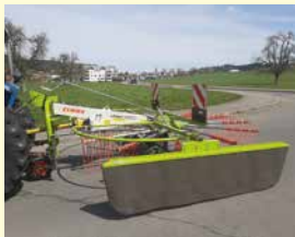
CLAAS Liner 420 Demo, Jg. 2022, 4.2 m Arbeitsbreite