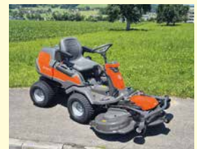
Husqvarna Rider 418TsX AWD Neu, Jg. 2024, 122 cm Schnittbreite

Auf unserer Webseite www.ruckliag.ch finden Sie unser gesamtes Occasions-Maschinen-Angebot! Oder rufen Sie uns an unter Telefon 041 928 16 16, wir beraten Sie gerne beim Kauf Ihrer Maschine.