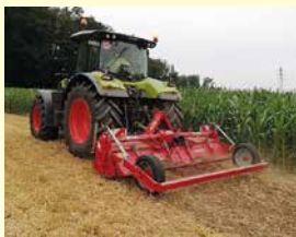
Breviglieri BIO Flachbeetfräse Neu, Jg. 2023