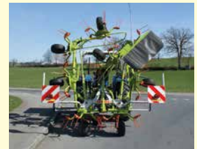
CLAAS Volto 80 Neu, Jg. 2024, Tastrad, Grenzstreueinrichtung