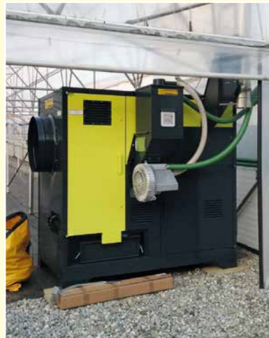
LASCO Warmluftöfen in drei verschiedenen Befeuerungsarten

Als Generalimporteur für die Schweiz bieten wir Ihnen das gesamte Produktprogramm des österreichischen Maschinenherstellers LASCO . Zum Sortiment gehören Maschinen zur Heubergung und Heutrocknung, sowie Systeme zur Aufbereitung von Energieholz.