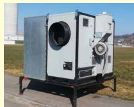
LASCO Pellets-Warmluftofen LA150P 1600 h, Jg. 2017, mit Vorratsbehälter