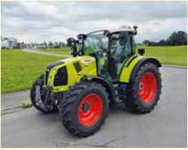
CLAAS Arion 470 CIS 3 h, Jg. 2024, FH, FZ, DL, Klima, VAF, GPS, Lenkauto.