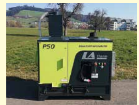
LASCO Pellets-Warmluftofen LA 50P, Neu, Jg. 2024, 50 kW Heizleistung