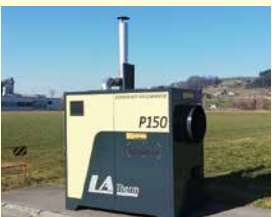
LASCO Pellets-Warmluftofen LA 150P Neu, Jg. 2024, 150 kW Heizleistung