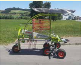
CLAAS Liner 370 Demo, Jg. 2024, 3.7 m Arbeitsbreite