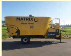
Matrix Radon 16, Demo, Jg. 2021, 16 m 3 , Schieber vorne mit Band, Waage