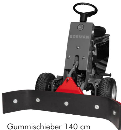
Gummischieber 140 cm