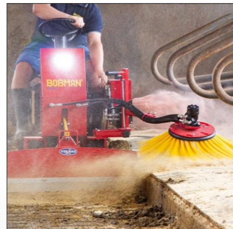
Kurzer Schieber mit Seitenbesen für Hochboxen