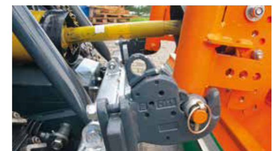
Geräteaufnahme der Kategorie 1 - Standardsystem zum Anbau Ihrer vorhandenen Anbaugeräte.