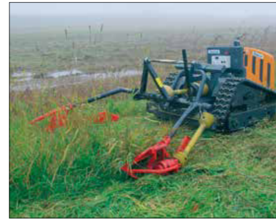
Einsatz in Feuchtgebieten