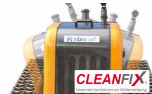
Der Yanmar Diesel Motor mit Cleanfix Wendelüfter, schwenkt automatisch entsprechend der aktuellen Hanglage.