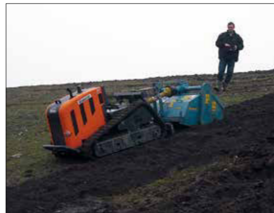
Bodenfräse im Deichbereich