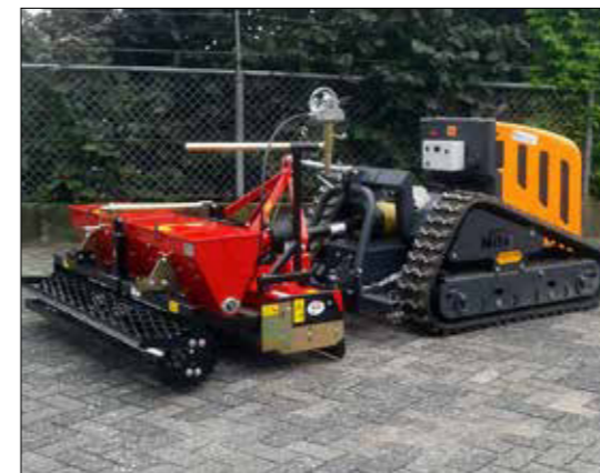
Kreislegge mit Sämaschine