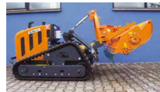
Der Kraftheber verfügt über eine extrem hohe Aushebung, mit einer Hubkraft von bis zu 450 kg.