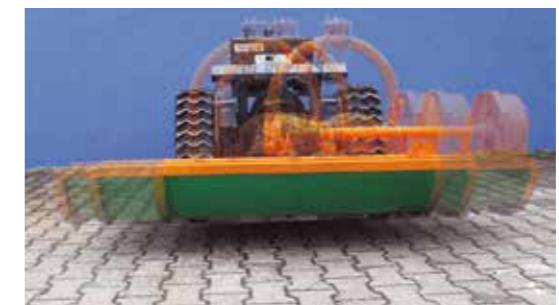
40 cm Seitenverschiebung zum echten randnahen Arbeiten an Zäunen, Treppen und Mauern.