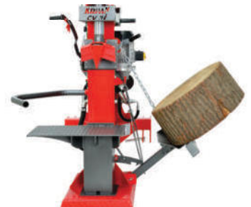
Zusätzliche Hubvorrichtung für Kurzholz