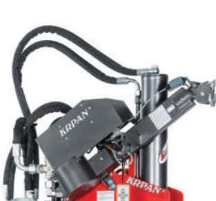
Hydraulische Winde (Option) mit Geschwindigkeitsregler und Funkfernsteuerung

Große Stahlbodenplatte aus Riffelblech (gegen Stammabrutschen)