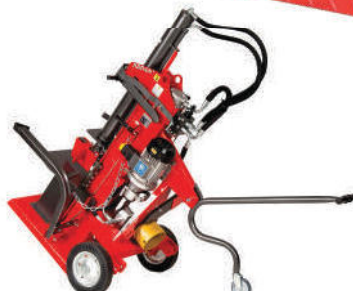
Fahrwerk mit Zughebel serienmäßig bei Modellen E und EK