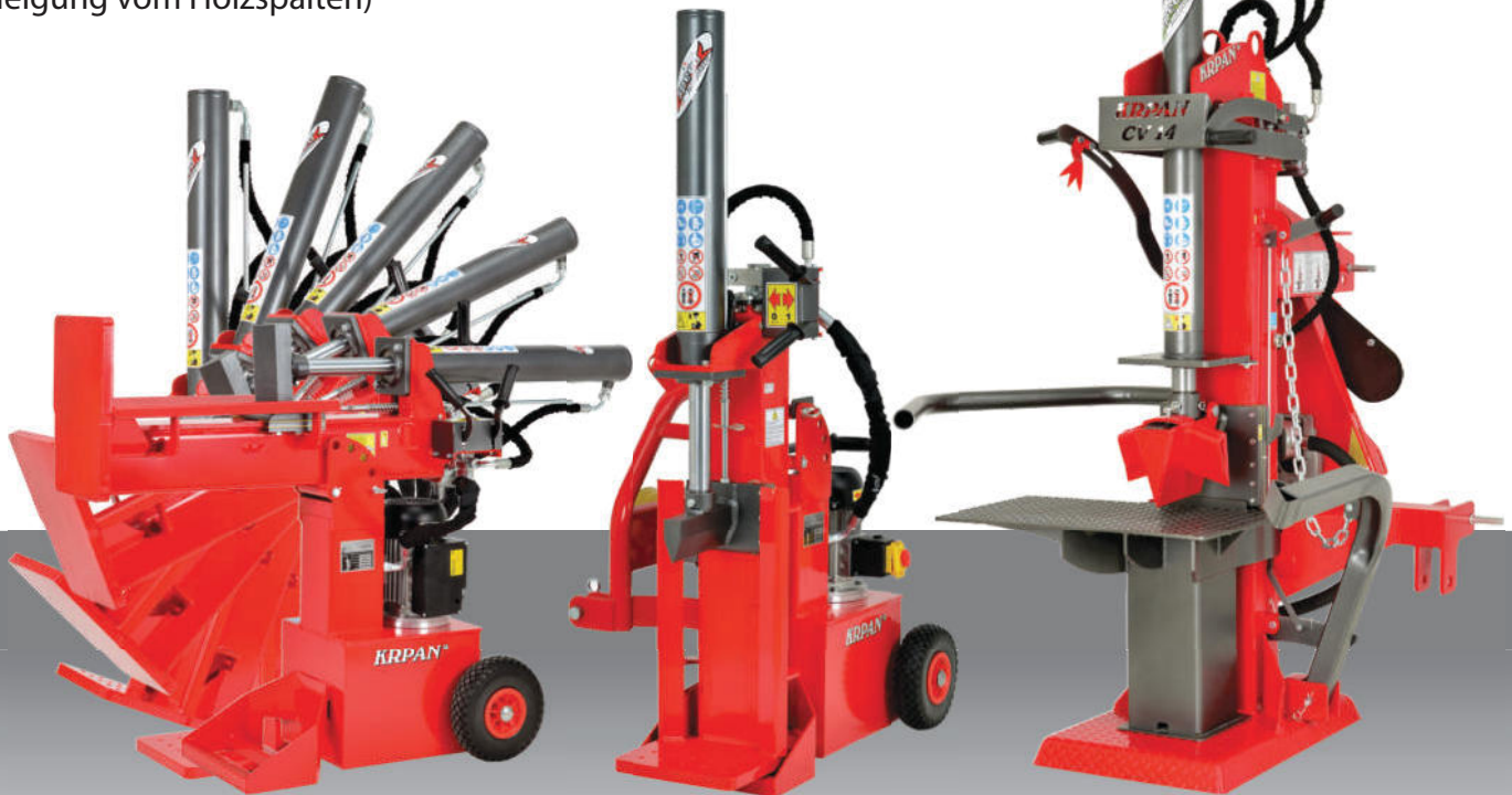
KRPAN C multi 11

Erlaubt 5 verschiedenen Positionen (Neigung vom Holzspalten)