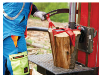
Linke Bedienungshebel mit integrierter Spaltgutfixierung und Spaltkreuz