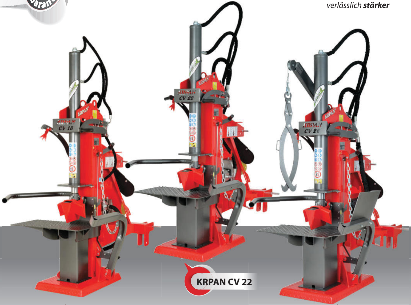
KRPAN CV 18