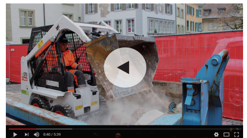
Video zur Maschine unter www.leiserag.ch