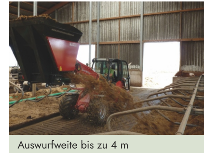
Auswurfweite bis zu 4 m