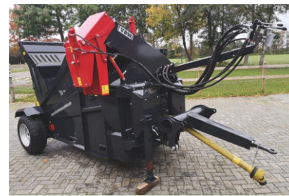
Hurricane T - gezogene Ausführung