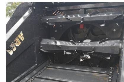
2 hydraulisch angetriebene Auflösewalzen mit hydraulischem Kratzboden