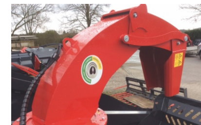
drehbarer Auswurf 270° (Duo)