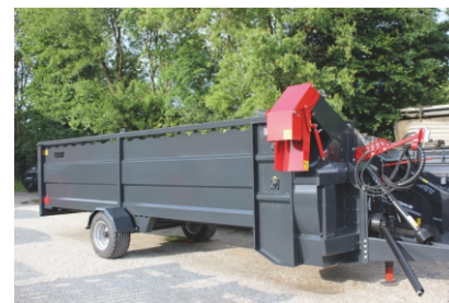
Hurricane T XXL für Rund- u. Quaderballen

* Bedienung über Handsteuerventile serienmässig