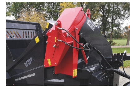
mit schwenkbarem Auswurf 45°