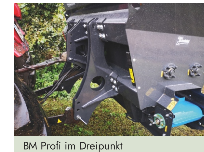
BM Profi im Dreipunkt