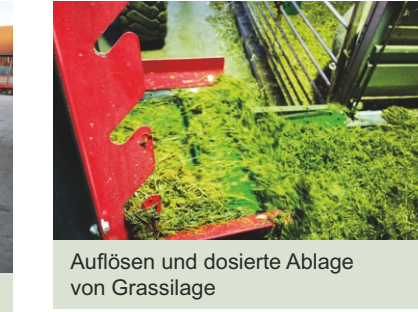
Auflösen und dosierte Ablage von Grassilage