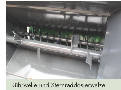
Rührwelle und Sternraddosierwalze