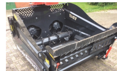
hydraulische Ladeklappe (Duo)