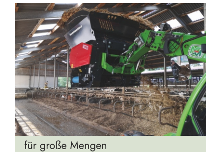
für große Mengen