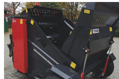
gezogene Ausführung mit hydr. Heckklappe