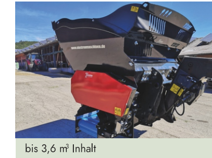
bis 3,6 m³ Inhalt