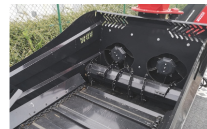
patentiertes Doppelwurfgebläse (Duo)