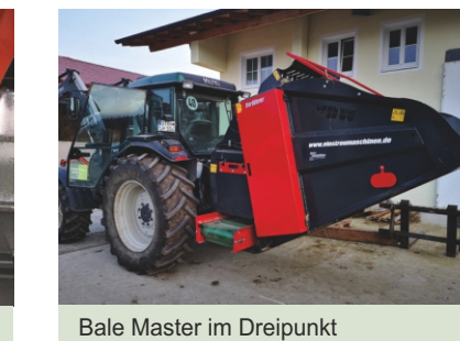
Bale Master im Dreipunkt