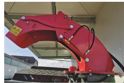
drehbarer Auswurf 270° optional