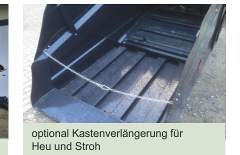
optional Kastenverlängerung für Heu und Stroh