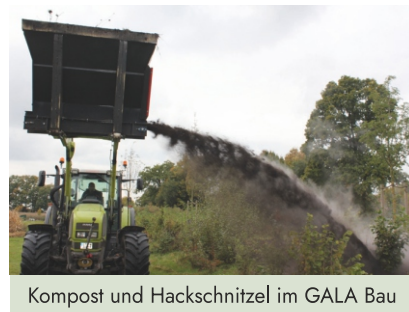
Kompost und Hackschnitzel im GALA Bau