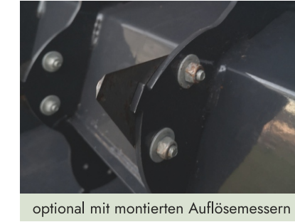
optional mit montierten Auflösemessern