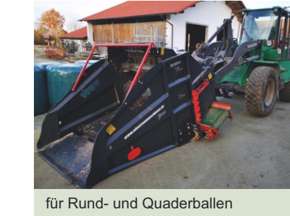
für Rund- und Quaderballen