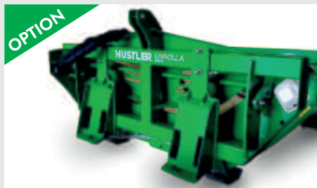
OPTION Bob-Tach Aufnahme, div. weitere Laderaufnahmen auf Bestellung