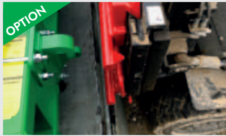
OPTION Aufnahme für Stapler mit ISO FEM I oder II