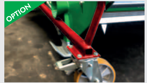
OPTION Fahrwerk mit Schwerlastrollen für kleine Traktoren und Stapler