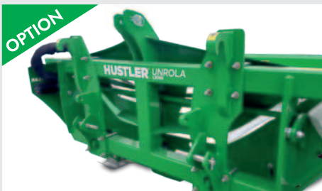
OPTION 3-Punkt und Euro8 Aufnahme