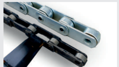
Die stärksten Ketten- und Bodenstangen halten die gesamte Lebensdauer des Auflöser