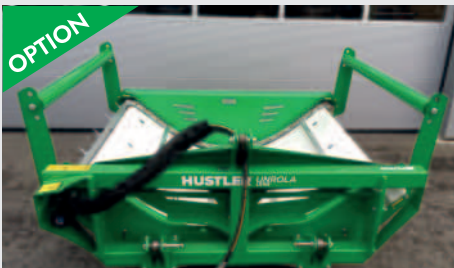
OPTION Sidebars, höhenverstellbar; damit unformige Ballen nicht herausfallen