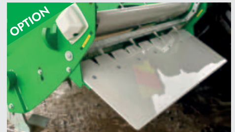
OPTION Seitenrutsche 40cm, damit das Futter weiter nach aussen getragen wird.