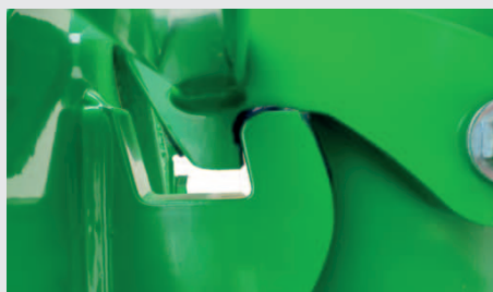
Patentiertes System zum automatischen Verbinden/Trennen. Beseitigt das mühsame Ziehen am Seil zum Trennen der Maschine