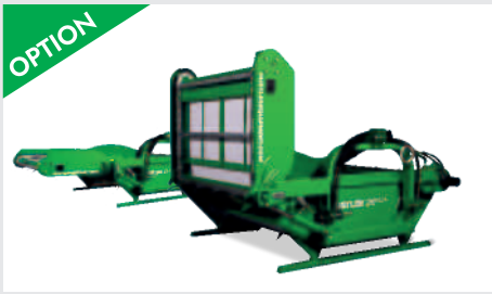
OPTION LM 105 T 1m seitlicher Ausleger für Futterkrippen