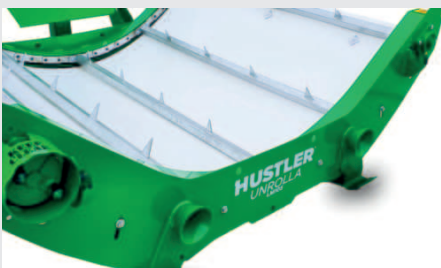
Robuster, sehr glatter und vollständig geschlossener Boden der die Antriebswellen abdeckt und so das Umwickeln verhindert