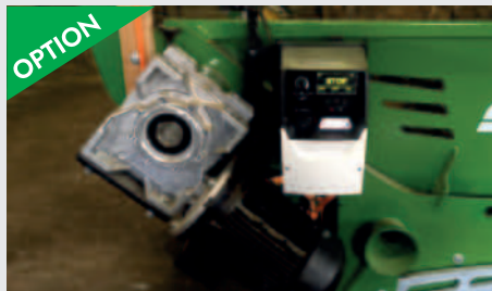
OPTION Elektrischer Antrieb 2.2kW Getriebemotor mit Frequenzumrichter stufenlos verstellbar Für stationären Betrieb in Scheune/Heuboden