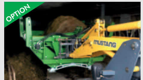
OPTION weitere Anbauvarianten für Lader und Stapler möglich