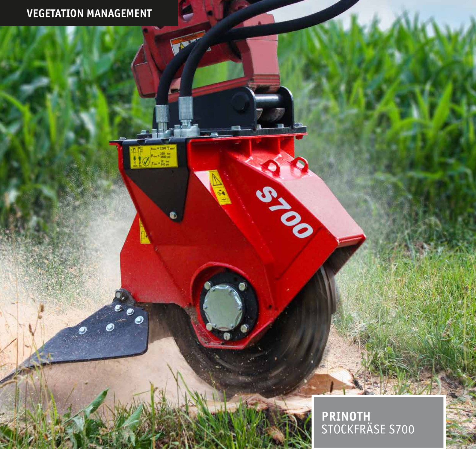
PRINOTH STOCKFRÄSE S700