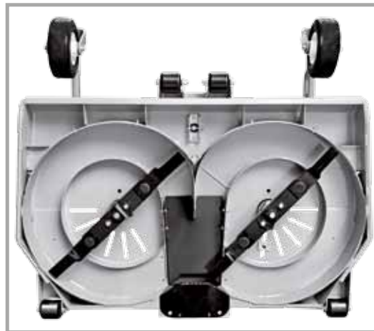
Serienmäßig Mulching Kit auf den Mähdecks mit Sammeln