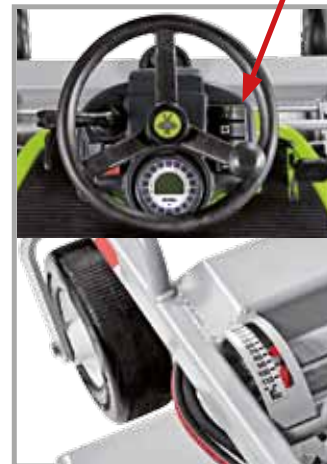
hydraulische Schnitthöhen- Schnellverstellung (stufenlos)

Der FD 13.09 kann mit einem Mähdeck mit Sammeln zu 132 cm und zu 155 cm ausgestattet werden; beide Modelle sind serienmäßig mit einem Mulch-Kit bestückt. Es handelt sich um äußerst solide Front-Mähwerke mit mechanischem Antrieb mit Kardan und Winkelgetrieben in Ölbad.