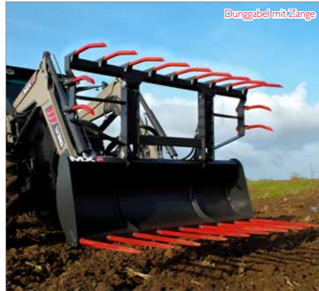
Dunggabel mit Zange

Optionen : Zange (1 DW Hydraulikfunktion erforderlich) - SPEED-LINK oder MACH 2 NS Stecker