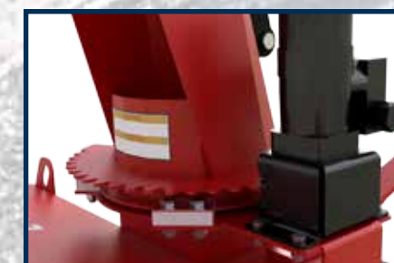
ROTATION DE LA CHUTE SUR POLYÉTHYLÈNE UHMV