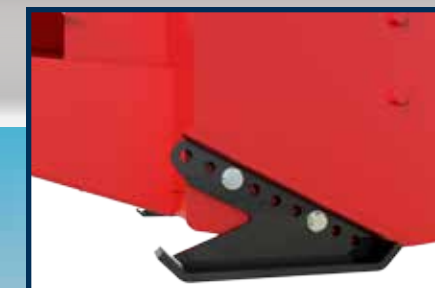
PATINS AJUSTABLES À ANGLE EN ACIER AU CARBONE