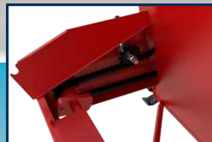
BOULON DE SÉCURITÉ SUR L'ARBRE DE COMMANDE ET TENDEUR À CHAÎNE