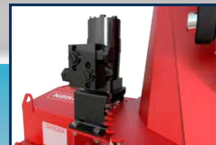
ROTATION DE LA CHUTE PAR MOTEUR HYDRAULIQUE (OPTIONNELLE)