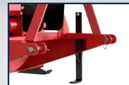
SUPPORT ARRIÈRE DE REMISAGE