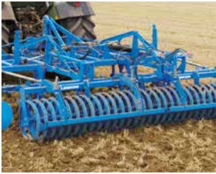
Messerwalze MSW 600

Die Messerwalzen setzen sich aus Ringen im Abstand von 125 mm zusammen.