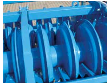
Packerdoppelwalze PDW 600/600

Durch die Anordnung von zwei Reihen Packerringen wird eine Wellenform auf der Bodenoberfläche erzeugt.