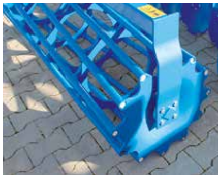
Rohrstabwalze RSW 540