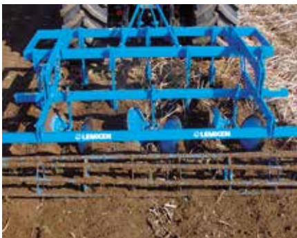
Rohrstabwalze RSW 400