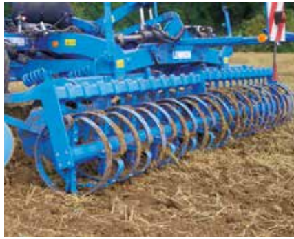
Flexringwalze FRW 540

Aufgrund der leicht walkenden Wirkung des Federbandes eignet sich die Flexringwalze besonders für nasse schwere, zum Kleben neigende Böden. Sie ist gewichtsgünstig und somit auch für Anbaugeräte bestens geeignet.