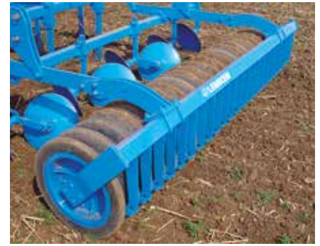
Gummiringwalze GRW 590

Die Gummiringwalzen bestehen aus einzelnen Gummiringen im Abstand von 125 mm. Dieser richtet sich nach den Abständen der nachfolgenden Drillschare, da der Saatbereich exakt vor diesen streifenweise rückverfestigt wird.