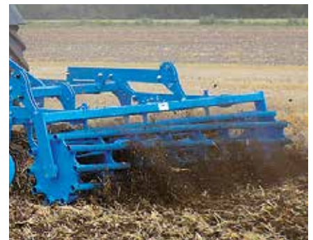
Rohrstabwalze RSW 600