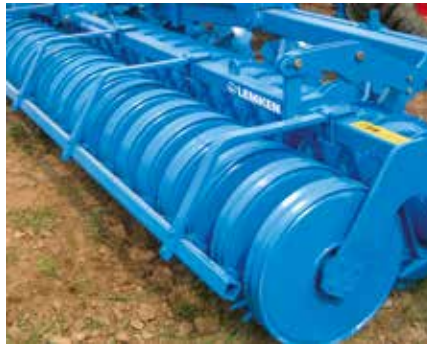
Packerprofilwalze PPW 600/540

Bei der tiefen Bearbeitung bis 30 cm wird der Boden intensiv gelockert und muss anschließend rückverfestigt werden.