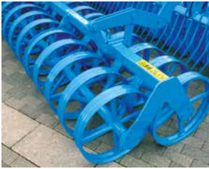
Doppelprofilringwalze DPW 540/540

Die Doppelprofilringwalzen haben einen Durchmesser von 540 mm und zeichnen sich durch eine hohe Tragfähigkeit auf leichten und mittleren Böden aus.