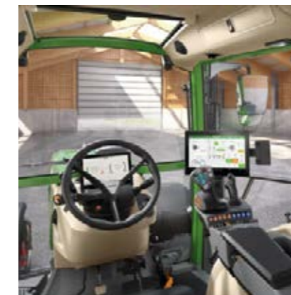
Profi Setting 2