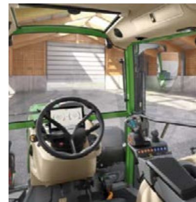
Power Setting 2