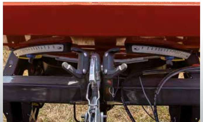
Gut einsehbare DfC-Skalen