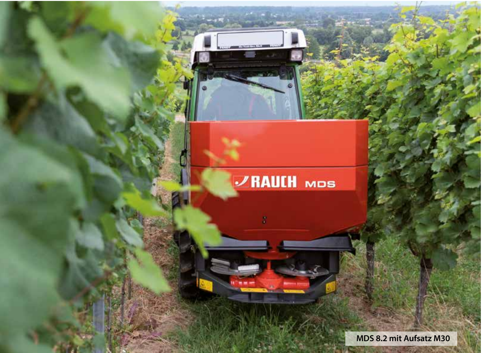
MDS 8.2 mit Aufsatz M30

MDS-Streuer sind unentbehrlich für den professionellen Einsatz im Obst-, Wein- oder Hopfenanbau und mit innovativen Detaillösungen perfekt auf diese Aufgabe vorbereitet.