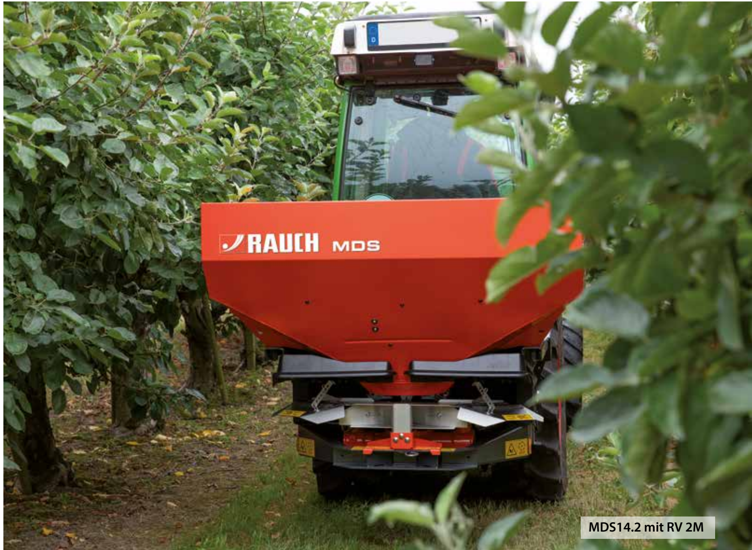
MDS14.2 mit RV 2M