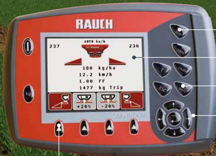
VariSpread Funktionen links/rechts