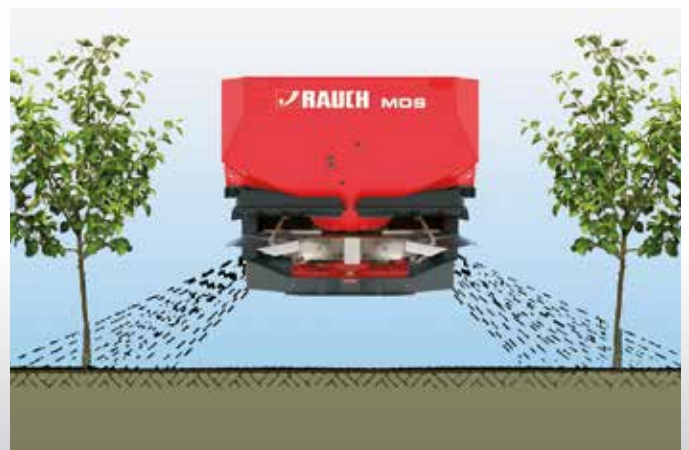
Wirkungsweise der Reihenstreuvorrichtung RV 2M

Die Reihenstreuvorrichtung RV 2M ermöglicht eine gezielte Nährstoffgabe im Wurzelbereich von Reinkulturen. In die Fahrspur fallen dabei keine Granulate. So wird wertvoller Dünger eingespart und die Umwelt entlastet. RV 2M lässt sich einfach und variabel auf Reihenabstände zwischen 2 bis 5 m einstellen.