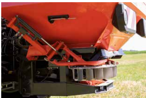
TELIMAT, Grenzstreuen aus der Fahrgasse

GSE 7 ist eine manuell bediente Grenz- und Randstreueinrichtung die einseitiges (nach links oder rechts) scharfkantiges Streuen direkt von der Feldgrenze ermöglicht. Die Einrichtung ist auf Wunsch fernbedienbar und kann auch mit TELIMAT kombiniert werden.