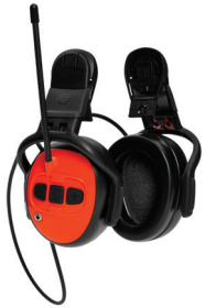
GEHÖRSCHUTZ MIT RADIO 578 27 49-04