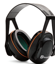
GEHÖRSCHUTZ GARDENER 505 69 90-12