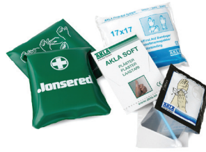
ERSTE-HILFE-KIT 502 52 55-01