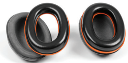
HYGIENE-KIT 597 79 52-01