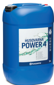
HUSQVARNA POWER 4 583 95 59-02