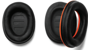
HYGIENE-KIT 596 48 94-01