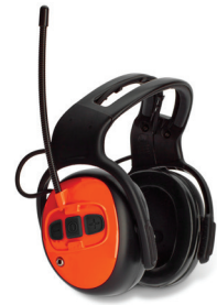
GEHÖRSCHUTZ MIT RADIO 578 27 49-03