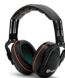
GEHÖRSCHUTZ 505 66 53-04