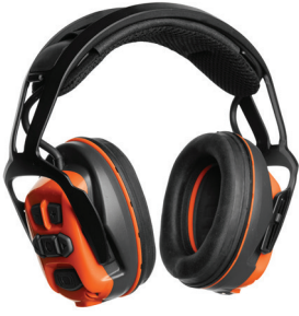
GEHÖRSCHUTZ X-COM R 595 08 40-01