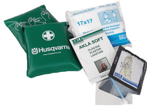
ERSTE-HILFE-KIT 504 09 53-01