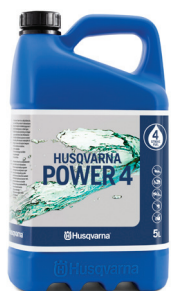
HUSQVARNA POWER 4 583 95 59-01