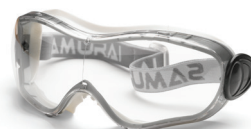
SCHUTZBRILLE, GOGGLES 544 96 39-01