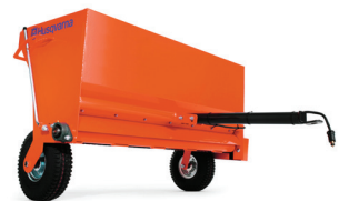
STREUWAGEN 596 29 30-01