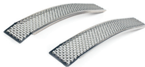
LADERAMPEN GEWÖLBT 505 69 90-43