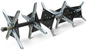
STERN-AERIFIZIERWELLE 588 21 27-01