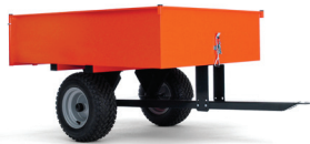
ANHÄNGER PROFI 953 51 17-02