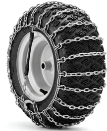
SCHNEEKETTEN 585 66 61-01