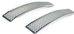
LADERAMPEN GEWÖLBT 505 69 90-41