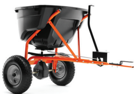
STREUWAGEN 75 967 02 72-01