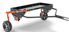
PLATTFORM 586 63 72-01