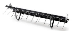
ENTMOOSER 586 63 68-01