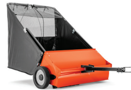
RASENKEHRMASCHINE 582 71 99-01