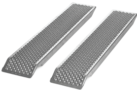
LADERAMPEN GERADE 505 69 90-40