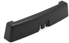
HECKGEWICHT 953 53 49-01