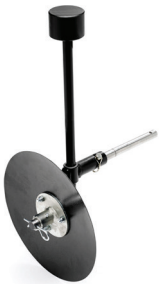
KANTENSCHNEIDER 953 53 10-01