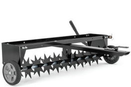
RASENLÜFTER 586 63 67-02