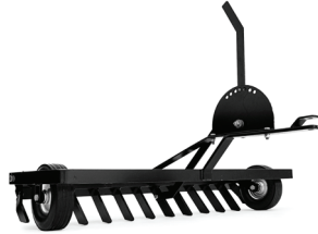
SCHOTTERHARKE 953 51 24-01