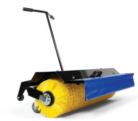
KEHRBÜRSTE 587 02 47-01