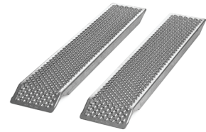
LADERAMPEN GERADE 505 69 90-42