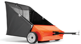
RASENKEHRMASCHINE 586 63 65-01