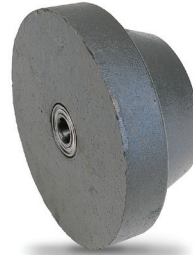
RADGEWICHT 953 51 59-02