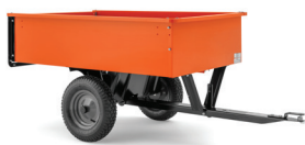
ANHÄNGER 275 501 00 82-01