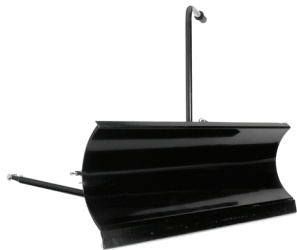
SCHNEERÄUMSCHILD 965 07 09-01