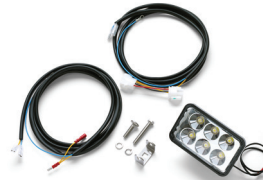
SCHEINWERFER-KIT 581 12 54-01