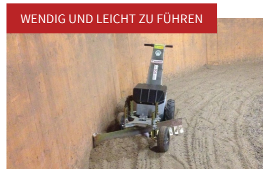
WENDIG UND LEICHT ZU FÜHREN

Einfach mit dem Hufschlagplaner an der Bande entlang fahren und in nur wenigen Minuten ist der Untergrund wieder plan.