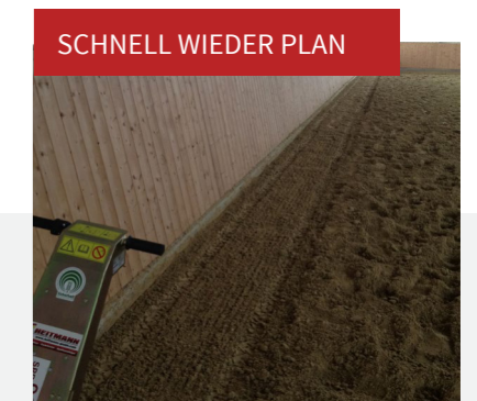
SCHNELL WIEDER PLAN