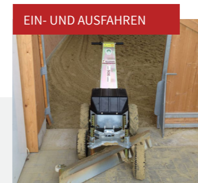
EIN- UND AUSFAHREN

Der HEITMANN Hufschlagplaner sorgt für einen geraden Plan auf ihrem Hufschlag, sowohl Innen- als auch auf den Außenreitplätzen - schnell und unkompliziert.