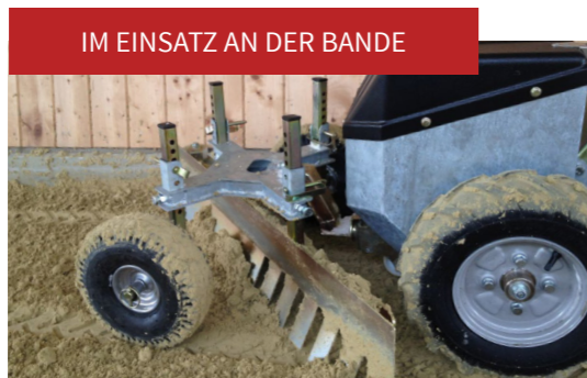
IM EINSATZ AN DER BANDE