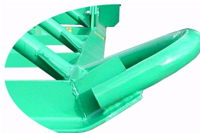
1. Schiene mit Bodenführungssohle, für schonende Vorarbeit

Die Kufen sind seitlich vorne hochgezogen, ein Einstecken wird somit verhindert