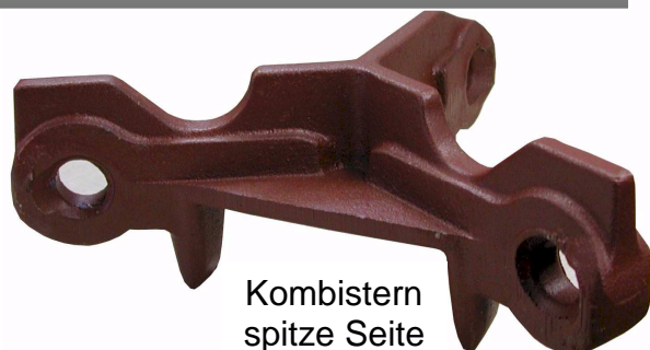
Kombistern spitze Seite

Die Wiesenegge KONDOR eignet sich hervorragend zum Abeggen von Wiesen und Weiden, sowie zum Ebenen und Planieren von Fahrspuren und Reitplätzen.