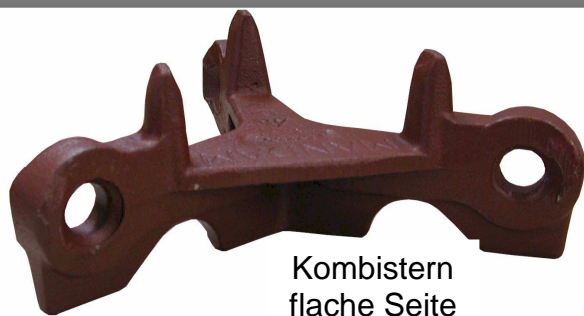
Kombistern flache Seite

Die Kondor Wieseneggensterne sind aus Sphäroguss gefertigt. Die Eggwerkzeuge sind durch diese Gussart sehr widerstandsfähig und dauerhaft.