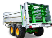
FERTI-CAP OPTION 899