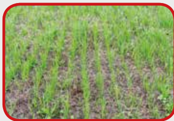
Während Vredo (Tag 13)