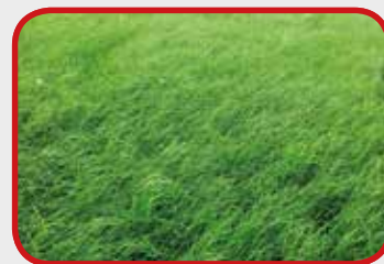
Nach Vredo (Tag 31)