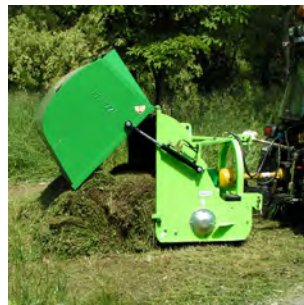
Scarico a terra mediante nr. 2 martinetti idraulici. Ground discharge by nr. 2 hydraulic rams.