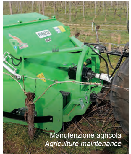
Manutenzione agricola Agriculture maintenance