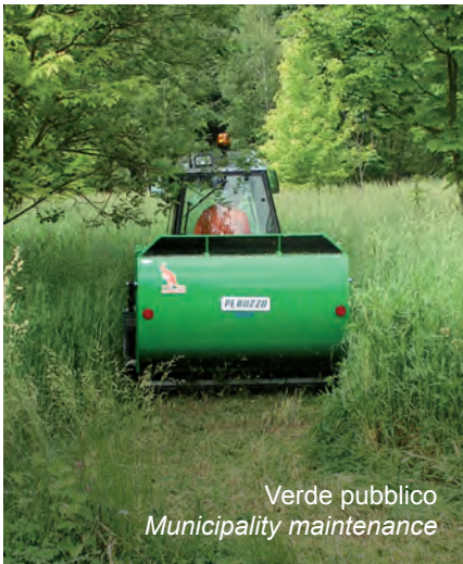
Verde pubblico Municipality maintenance