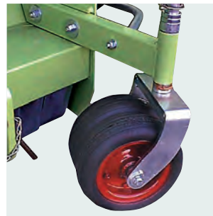
Regolazione dell'altezza di taglio su ruote frontali doppie. Height of cut adjustment on front castor double wheels.