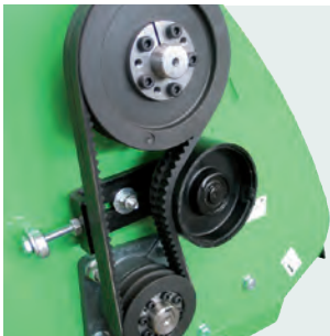
Facile tensione cinghie. Easy belts tightening adjustment.