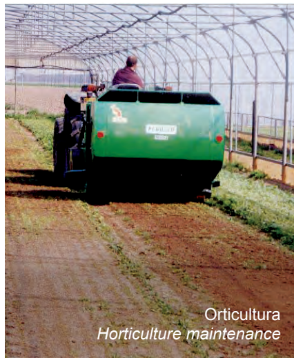
Orticoltura Horticulture maintenance