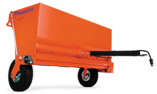
STREUWAGEN 596 29 30-01