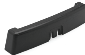
HECKGEWICHT 953 53 49-01