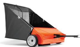
RASENKEHRMASCHINE 586 63 65-01