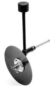
KANTENSCHNEIDER 953 53 10-01