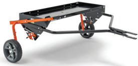
PLATTFORM 586 63 72-01