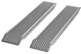
LADERAMPEN GERADE 505 69 90-40