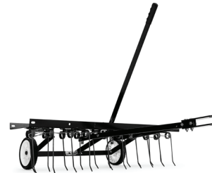
ENTMOOSER 586 63 66-01