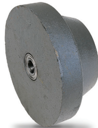
RADGEWICHT 953 51 59-02