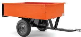
ANHÄNGER 275 501 00 82-01