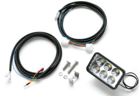
SCHEINWERFER-KIT 581 12 54-01