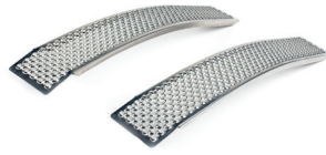
LADERAMPEN GEWÖLBT 505 69 90-41