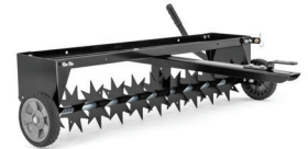
RASENLÜFTER 586 63 67-02