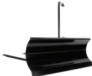
SCHNEERÄUMSCHILD 965 07 09-01