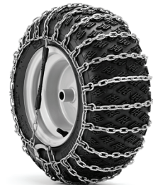
SCHNEEKETTEN 585 66 61-01