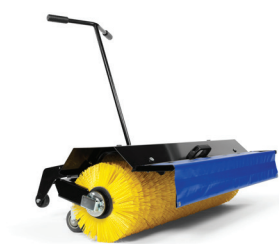
KEHRBÜRSTE 587 02 47-01