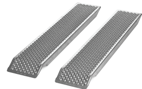
LADERAMPEN GERADE 505 69 90-42