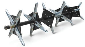
STERN-AERIFIZIERWELLE 588 21 27-01