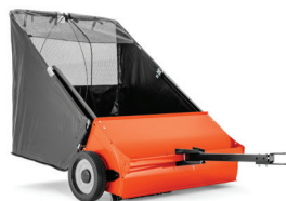
RASENKEHRMASCHINE 582 71 99-01