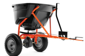
STREUWAGEN 75 967 02 72-01