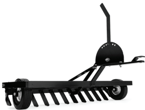
SCHOTTERHARKE 953 51 24-01