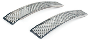
LADERAMPEN GEWÖLBT 505 69 90-43